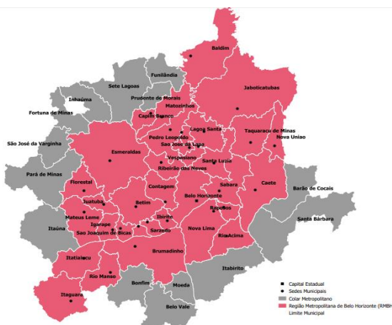
Figura 1 – RMBH e Colar Metropolitano

A Região Metropolitana de Belo Horizonte (RMBH) foi instituída em 1973, pela Lei Complementar n. 14. A RMBH é o centro político, financeiro, comercial, educacional e cultural de Minas Gerais, representando cerca de 40% da economia e 25% da população do estado. Atualmente, a Grande BH conta com a participação de 34 municípios. Além desses, há o Colar Metropolitano, composto por 16 municípios do entorno da RMBH.