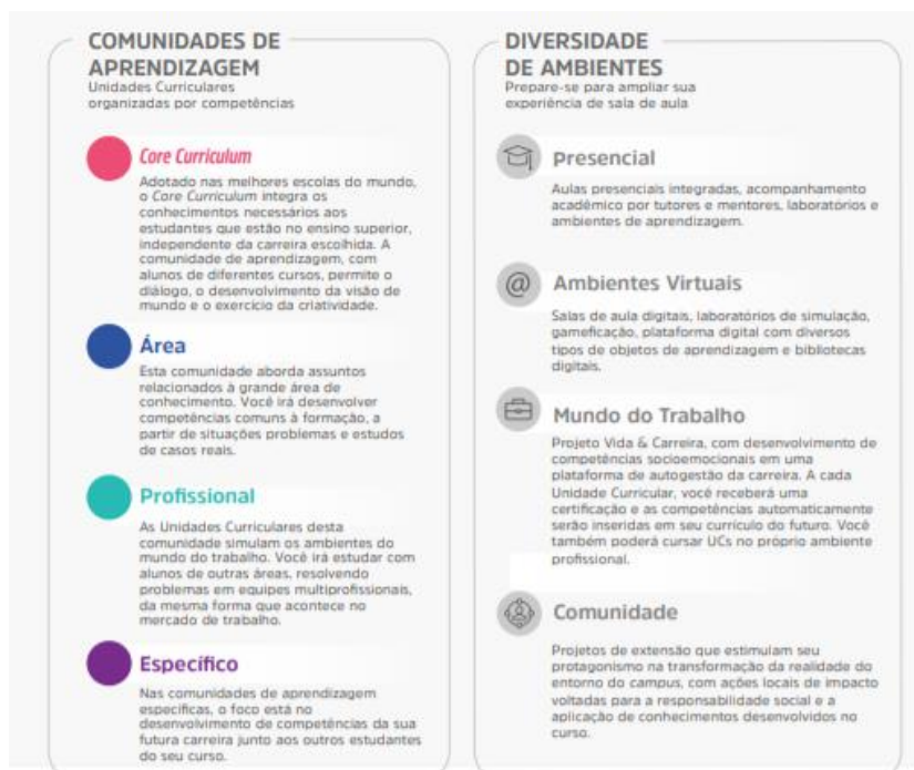
Figura 1 – Comunidades de aprendizagem e diversidade de ambientes

Assim, durante o seu percurso formativo, o estudante desenvolve, de forma flexível e personalizada, conforme perfil do egresso, as competências, conhecimentos, habilidades e atitudes de trabalho em equipe, resolução de problemas, busca de informação, visão integrada e humanizada.