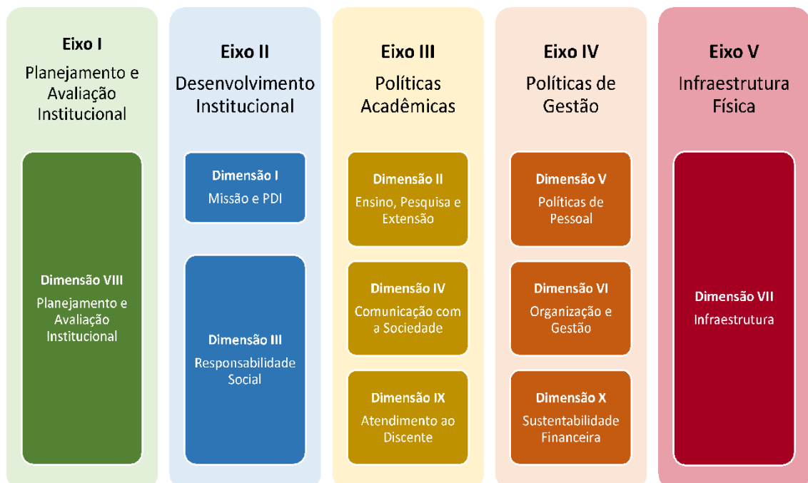
Figura 2 – Eixos e dimensões do SINAES

Essa autoavaliação, realizada em todos os cursos da IES, a cada semestre, de forma quantitativa e qualitativa, atenderá à Lei do Sistema Nacional de Avaliação da Educação Superior (SINAES), nº 10.8601, de 14 de abril de 2004. A legislação irá prever a avaliação de dez dimensões, agrupadas em 5 eixos, conforme ilustra a figura a seguir.