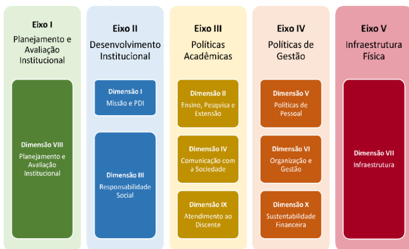
Figura 2 – Eixos e dimensões do SINAES

Essa autoavaliação, realizada em todos os cursos da IES, a cada semestre, de forma quantitativa e qualitativa, atenderá à Lei do Sistema Nacional de Avaliação da Educação Superior (SINAES), nº 10.8601, de 14 de abril de 2004. A legislação irá prever a avaliação de dez dimensões, agrupadas em 5 eixos, conforme ilustra a figura a seguir.