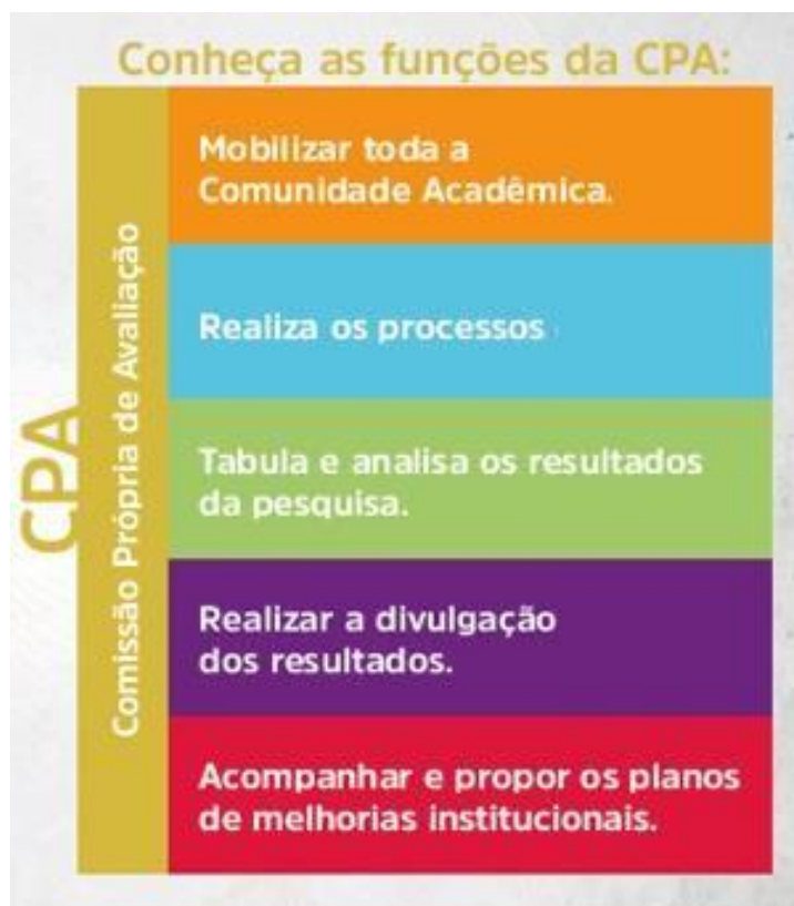
Figura 3 – Funções CPA